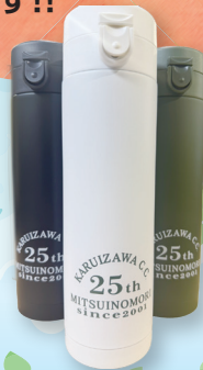
三井の森軽井沢 カントリー倶楽部様