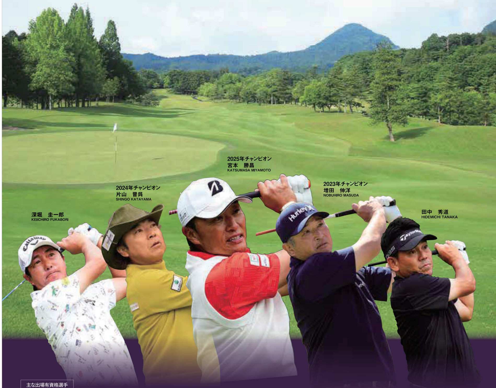
2025年チャンピオン 宮本 勝昌 KATSUMASA MIYAMOTO