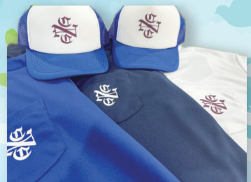
日本カントリークラブ様