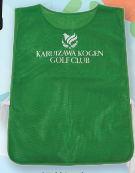
軽井沢高原 ゴルフ倶楽部様